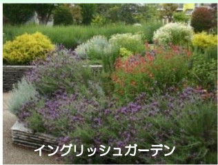
イングリッシュガーデン