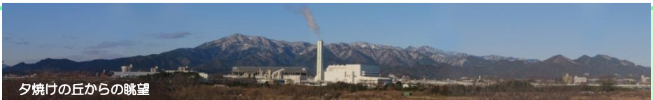
夕焼けの丘からの眺望